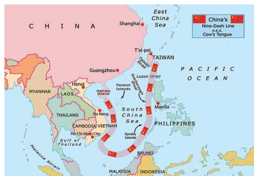
Gambar 1. Nine-Dash Line Laut Tiongkok Selatan

Konflik sengketa wilayah yang terjadi di Laut Tiongkok Selatan merupakan sengketa maritim kompleks yang melibatkan klaim tumpang tindih antara Tiongkok, Filipina, Vietnam, Malaysia, Brunei Darussalam, Taiwan, dan Indonesia. Tiongkok mengklaim sebagian besar wilayah tersebut melalui garis demarkasi sepihak yakni Nine Dash Line (sembilan garis putus-putus) (Susanti, 2025). UNCLOS ( United Nations Convention on the Law of the Sea ) 1982 telah menetapkan batas ZEE (Zona Ekonomi Eksklusif) setiap negara untuk memiliki hak penuh atas eksploitasi sumber daya dan penerapan kebijakan maritim. Meski demikian, Tiongkok secara unilateral mengklaim hak historis maritim mereka seluas 2.000 km 2 , yang didasarkan pada argumentasi bahwa hak tersebut telah eksis jauh sebelum ratifikasi UNCLOS 1982 (Adhi, 2021).